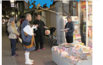
お店の前ではお客さんもびっくりです。