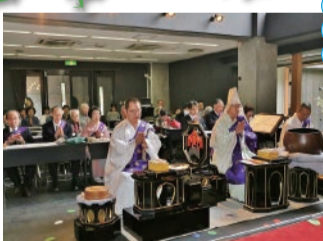
自他彼此の心なく水魚の思いを成す