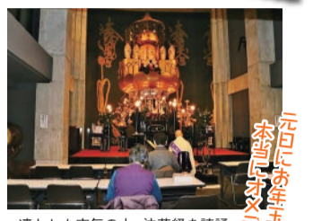
凜とした空気の中 法華経を誦読