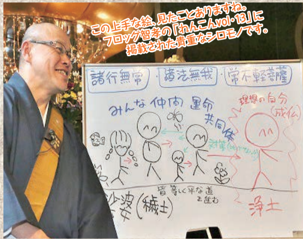
この上手な絵、見たことありませんか？ 7回ワグワグの「わんこんVol.13」に 掲載された貴重なシロモノです。

教育って目的は一体ナンナン？ 子供は学校に行って何を学ぶのでしょうか。国語・算数・理科・社会？ 勉強するのは何の為なのでしょう。教育の目的は何処にあるのでしょうか。 一人前の大人ってどんな大人？ 今回は前回のお話の続きで、次回にまた続くかもしれないので、日朝上人の目薬を入れてから読んでください。 さて娑婆世界は、色んな生物がいて様々な物があって社会が形成されています。そして人間はその中で、理想の自分に向かって前へ進み、浄土を作らなければなりません。人と人を比べないで、縦の関係ではなく、横の人間関係を築き上げましょう。全てが繋がっているこの娑婆世界は運命共同体なのです。 この娑婆の中で自分がどう生きるか？自分の居場所をみつけ他人とどう関わればよいのか？