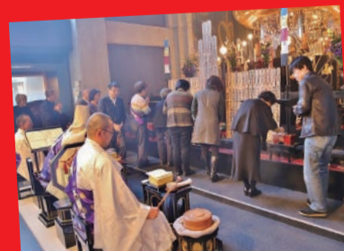
こちらがメインですよ。春彼岸せがき法要