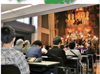
異体同心にして南無妙法蓮華經と唱え奉る処