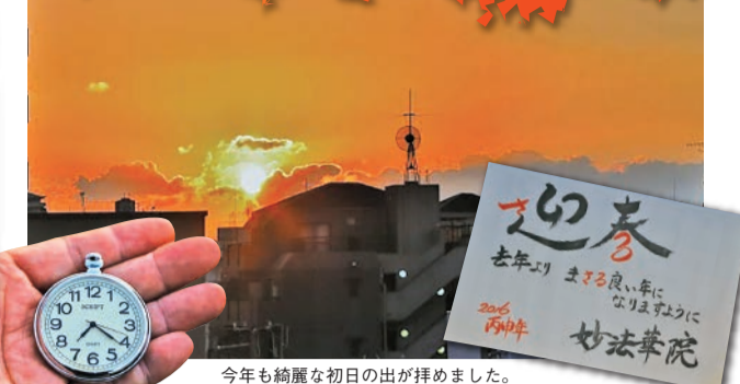
今年も綺麗な初日の出が拝めました。