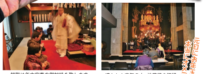
初詣は年中安泰の御加持を致します。