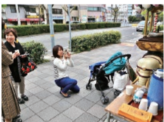
わざわざ来て下さった親子孫の三世代