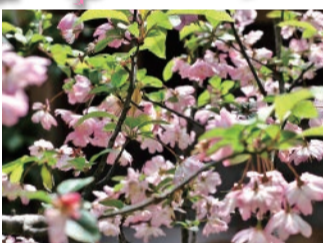
お寺のカイドウも花まつり