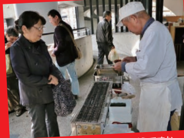
焼きたてアツアツのお団子。どうですか〜