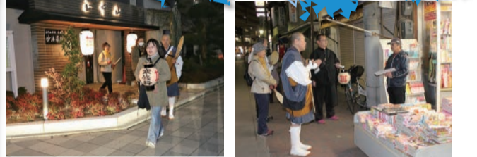
今年も陽子も久しぶりに歩きました。