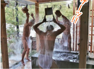
99.9%これで除菌できました。