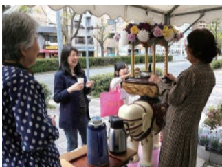
子供さんに甘茶をかけてもらう釈尊の水行