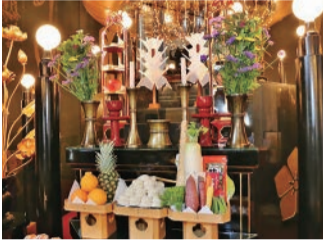
お供の盛り付け。コレって才能アリ? ナシ?