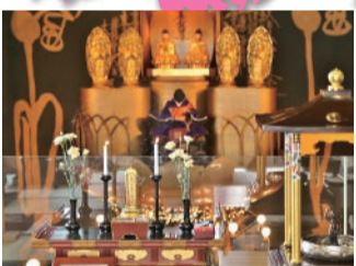
花まつりの日は、先代の祥當祥月命日